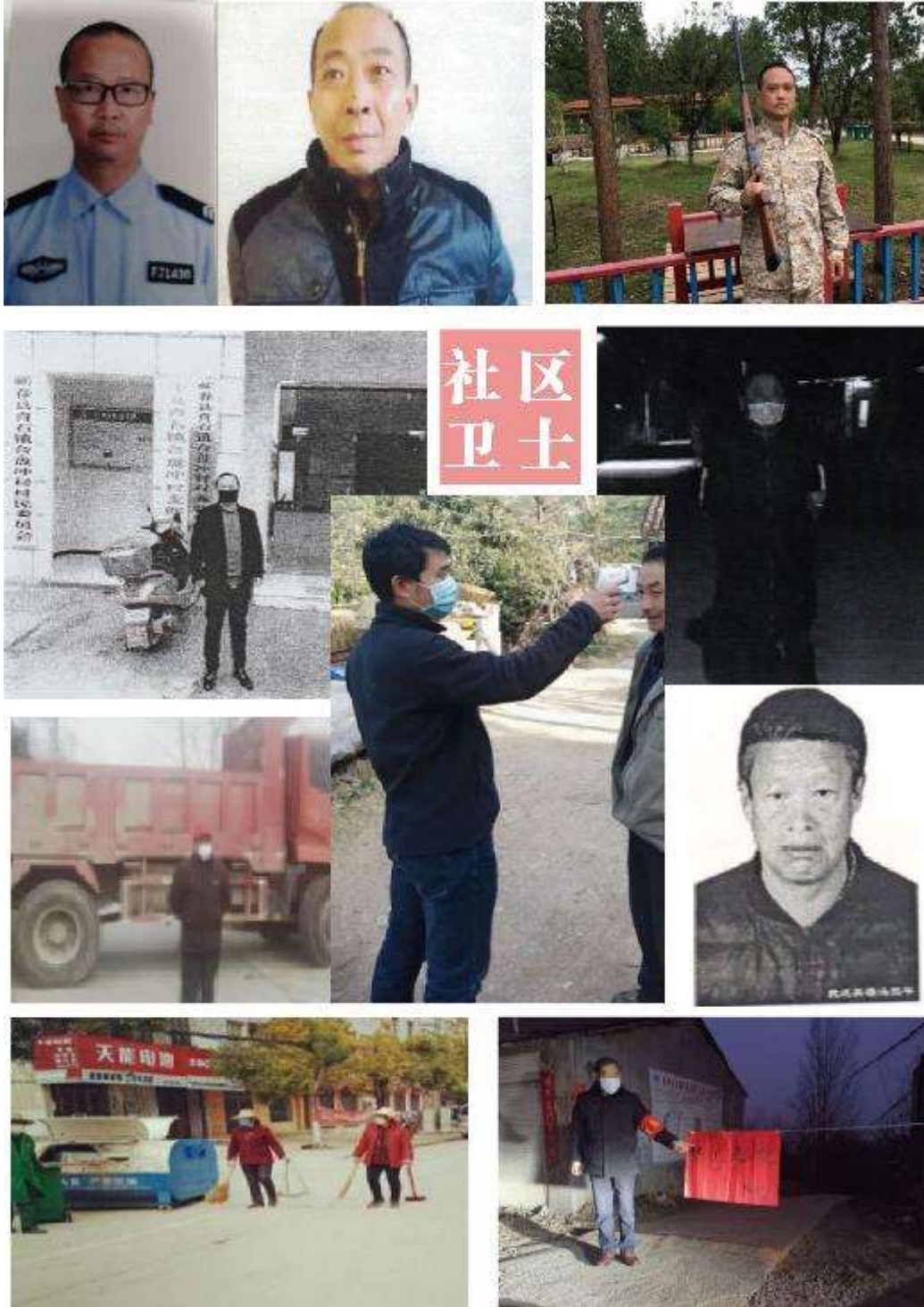
殉职社区卫士们工作的身影