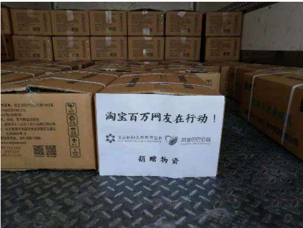
2月2日，1000瓶免洗手消毒液从江苏淮安发货，发往宜昌市惠民医院