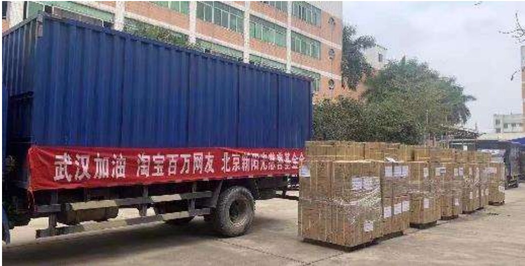
2月12日，320台欧格斯制氧机从广州发货寄往湖北