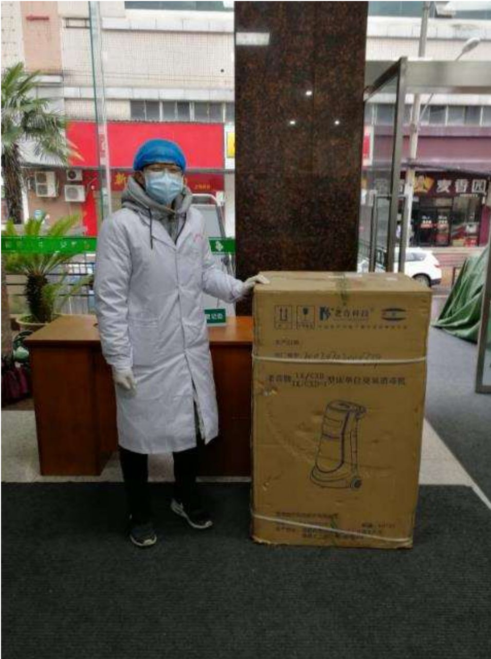
2月28日，武汉市中心医院接收到1台床单位消毒机