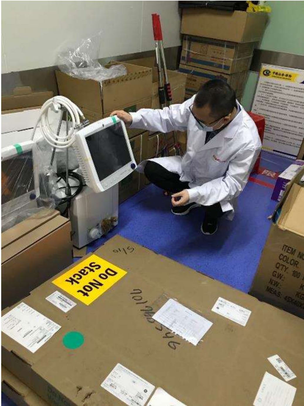
2月9日，武汉市新洲区人民医院青海赴鄂医疗队正在调试刚收到的2台GE呼吸机