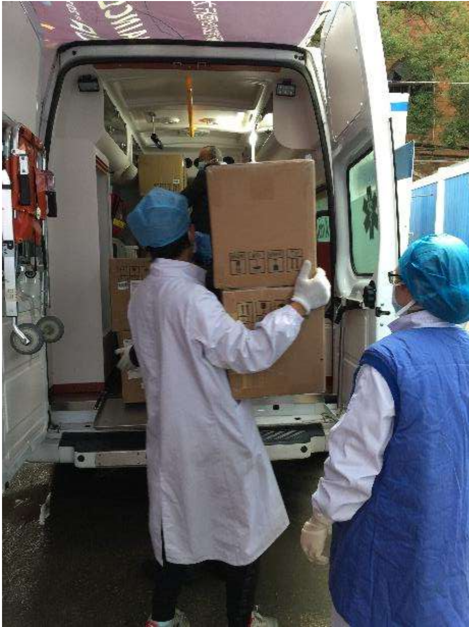
2月10日，华中科技大学同济医学院附属协和医院接收55台迈瑞监护仪