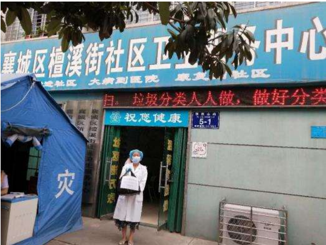
襄城区社区卫生服务中心医护人员接收护目镜