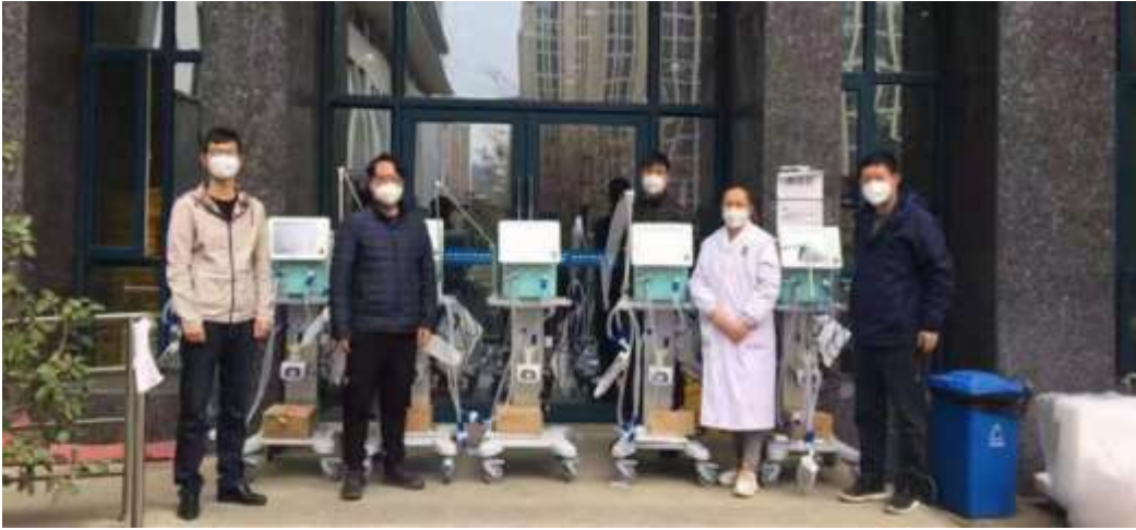
武汉市中医院汉阳院区接收谊安呼吸机