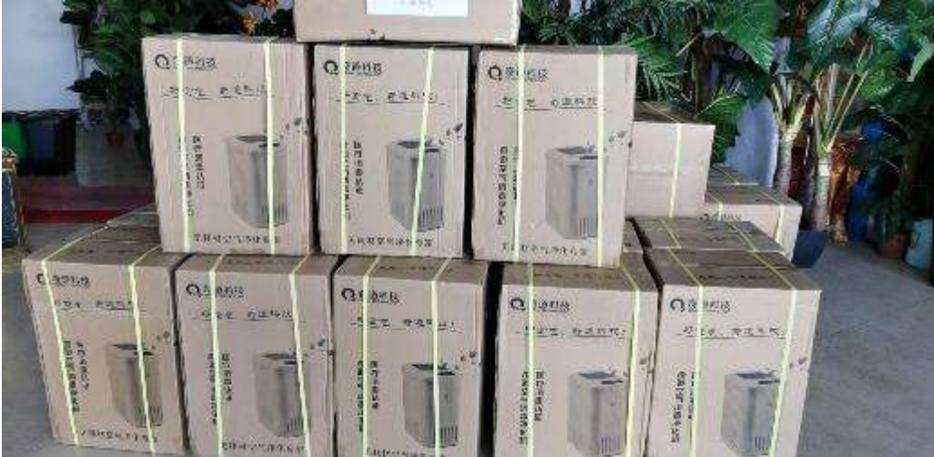
2月4日，从上海发出的30台奇道空气净化杀菌器顺利抵达新洲区中医医院