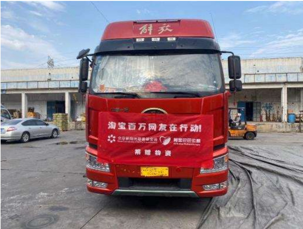
运送消毒机的物流车准备出发前往武汉