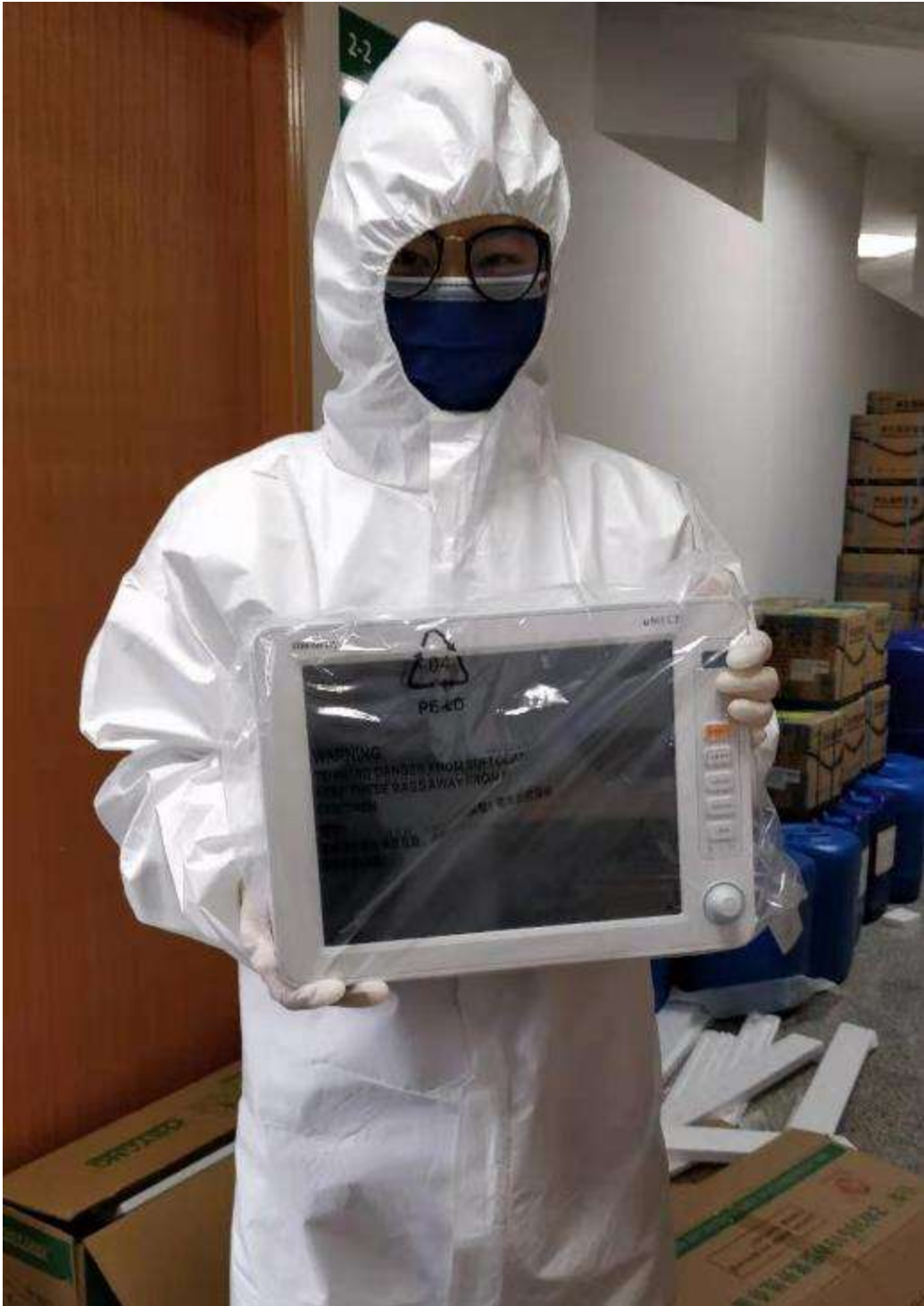
2月7日，武汉市中心医院接收到病人监护仪5台