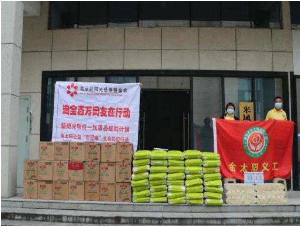
来凤县金太阳义工们为困难家庭送去米、油等物资