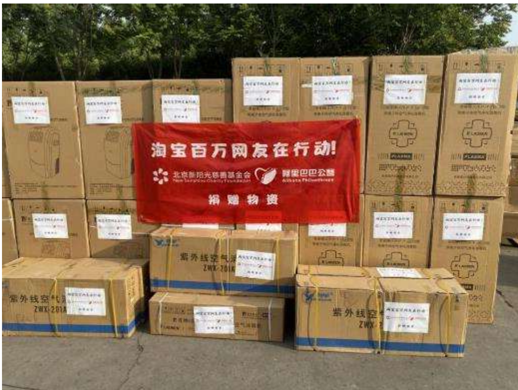
紫外线消毒机发货图