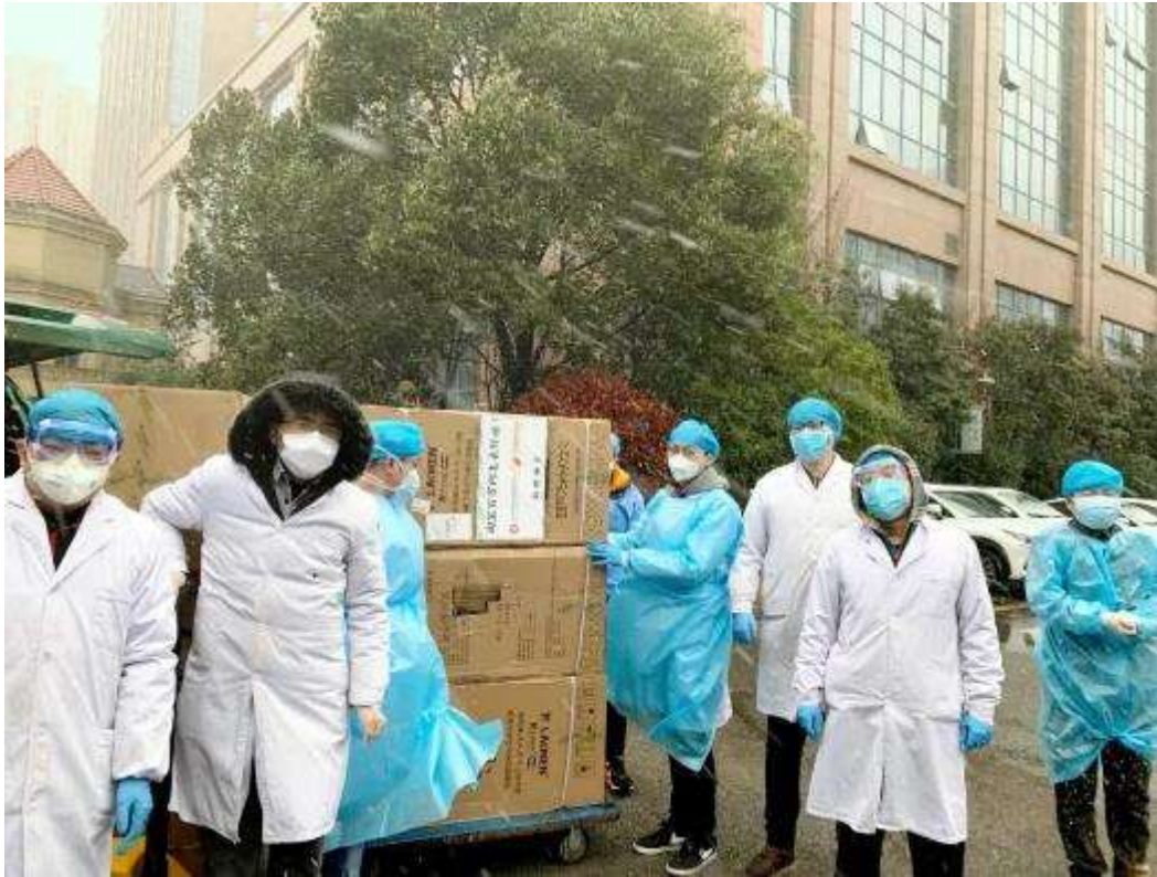
武汉市中心医院在风雪中接收我们捐赠的老肯牌等离子空气消毒机