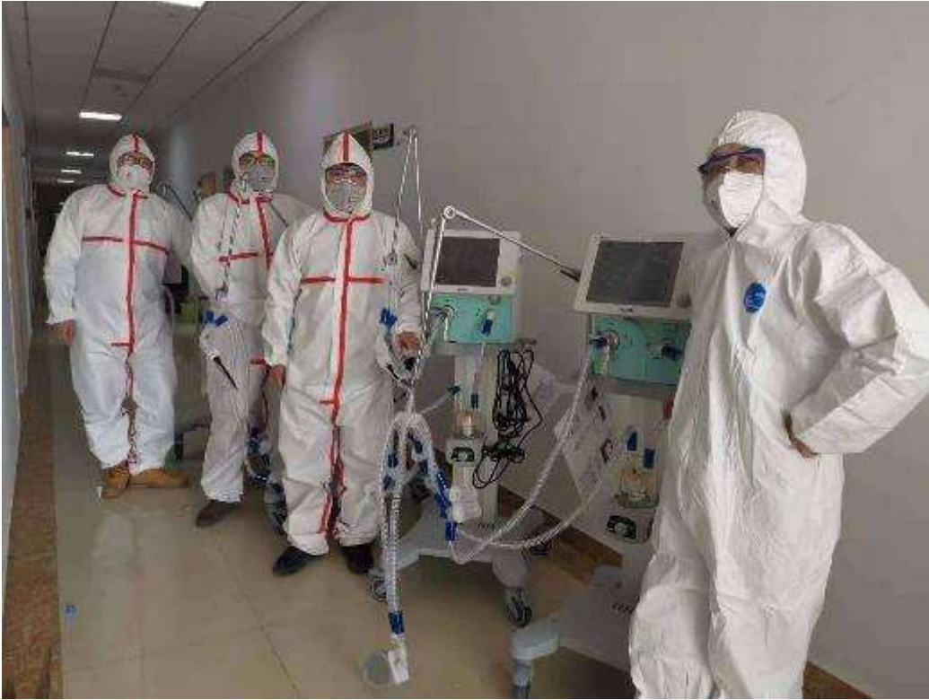
2月27日，武汉中心医院接收 VG70 呼吸机