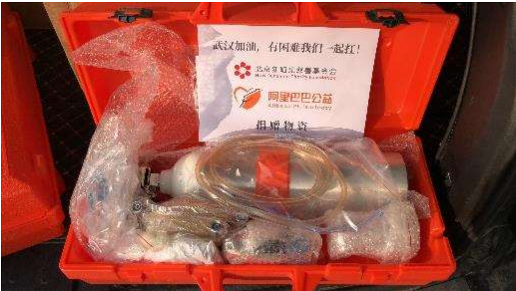
2月10日，20台加拿大O-TWO气动急救呼吸机从北京发货寄往湖北