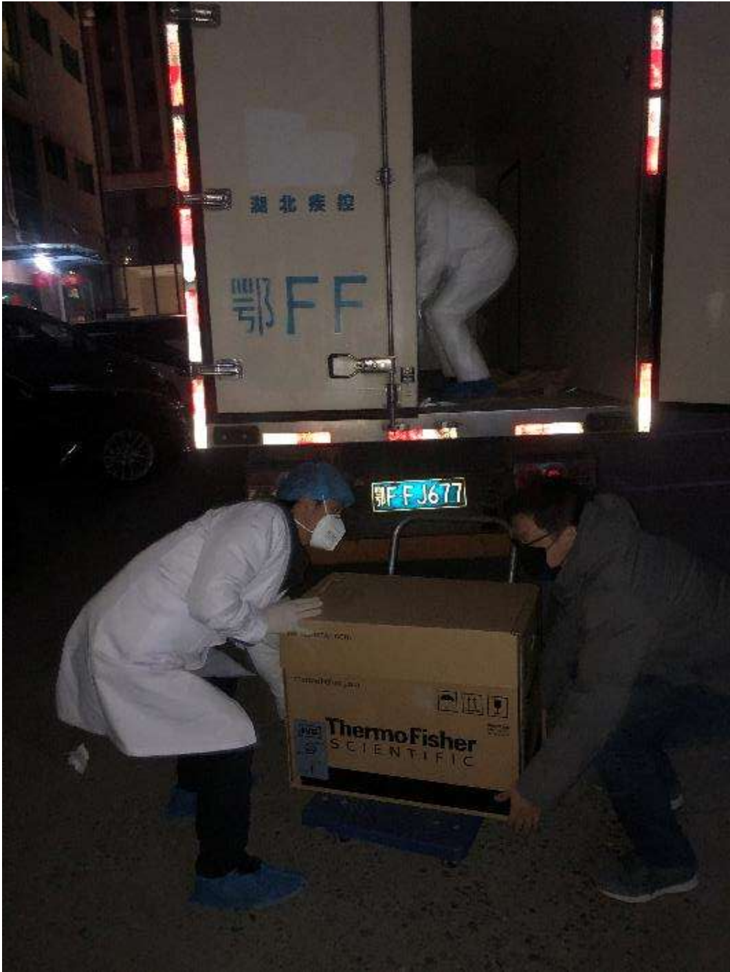
2月5日，襄阳市疾病预防控制中心在凌晨接收荧光定量PCR仪1台