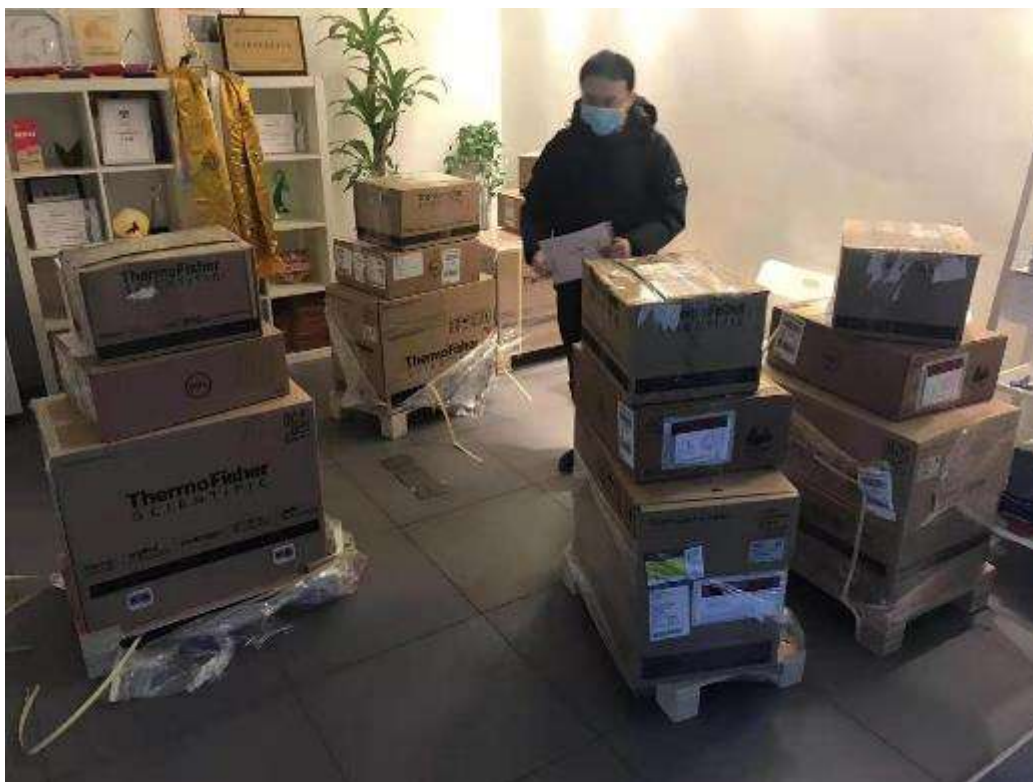
2月7日，4台荧光定量PCR仪从北京发往湖北