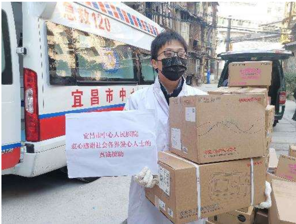
2月20日，宜昌市中心人民医院接收鱼跃呼吸机8台