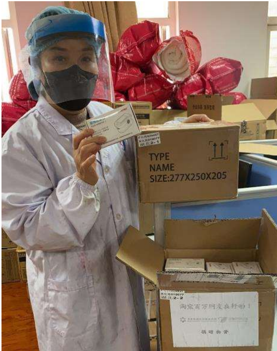
2月11日，黄州区人民医院接收血氧仪