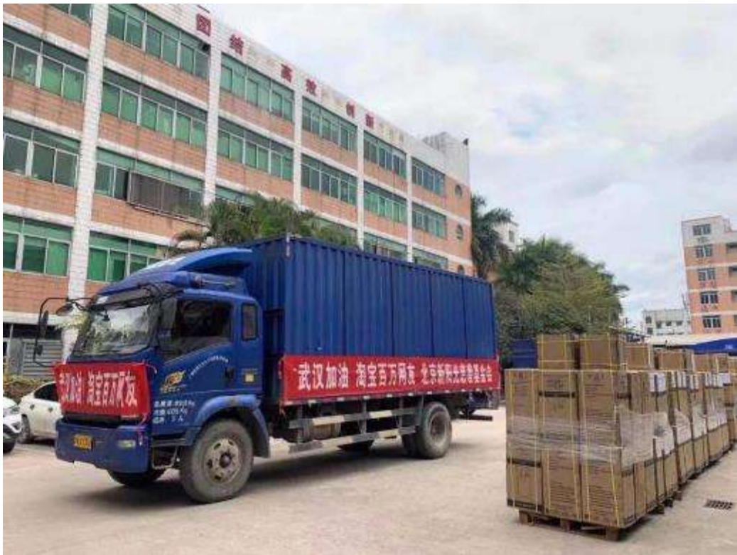
欧格斯制氧机准备启程发往湖北

足，很多其他科室病房被征用为呼吸科病房，但缺少设备。我们为湖北省内医院提供制氧机、呼吸机、高流量氧疗仪、监护仪、血氧仪、床旁彩超等物资，提升其对于患者的治疗能力，让更多患者通过合适的支持性治疗保持在轻症状态，减少其向重症的转化。我们捐赠的治疗和监测类物资具体包括：多参数病人床边监护仪 20 台、迈瑞病人监护仪 10 台、柯林监护仪 130 台、迈瑞 N12 监护仪 18 台、一次性采血管 12600 套、加拿大 O-TWO 气动急救呼吸机 20 台、呼吸机（Shangrila510S）42 台、北京谊安 VG70 呼吸机 30 台、瑞思迈呼吸机 100 台、GE 呼吸机 5 台、鱼跃呼吸机 501 台、迈瑞心电监护仪 65 台、康泰脉搏血氧仪 4088 台、5L 制氧机 900 台、一次性使用鼻氧管 5000 支、迈瑞 M7 彩色超声多普勒仪 14 台、康泰 ECG1200D 心电图机 4 台、斯百瑞高流量无创呼吸机湿化治疗仪 50 台、TF5000 医用空气压缩机 3 台；我们还捐赠了其他物资，包括烘干机 5 台、洗衣机 5 台。