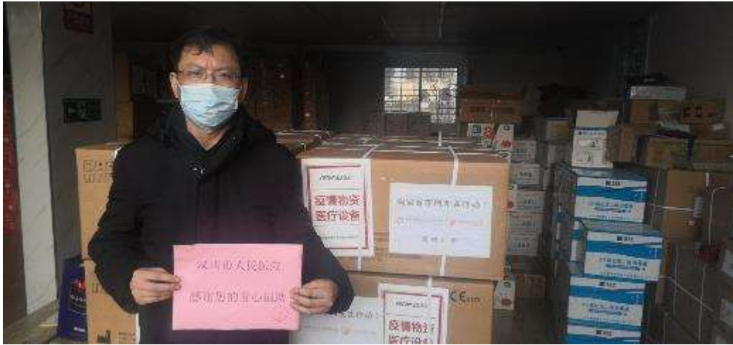
2月8日，汉川市人民医院接收空气净化消毒机15台