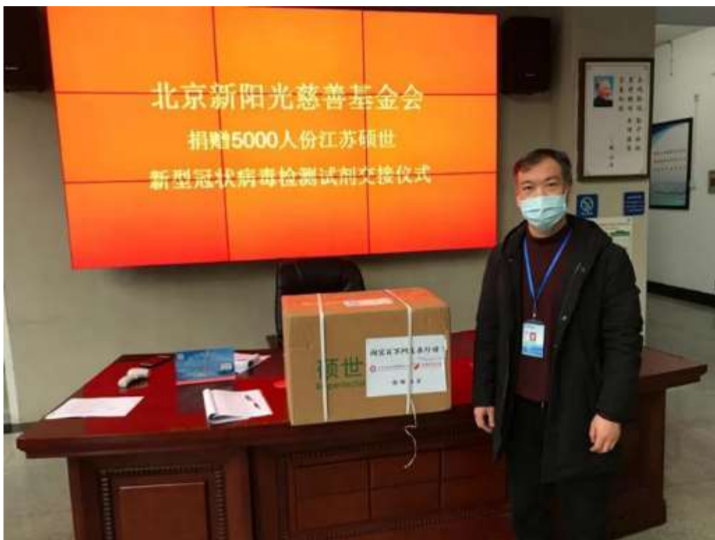
宜昌市疾控中心接收 5000 人份新冠病毒检测试剂盒