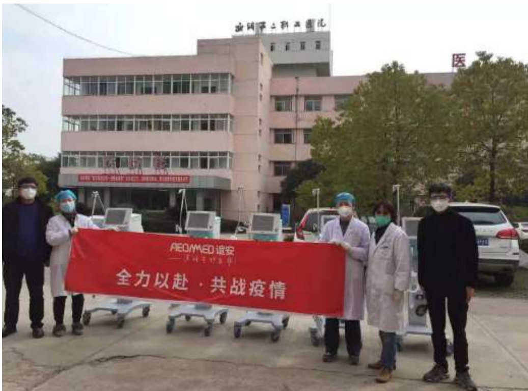
2月13日，武汉钢铁公司第二职工医院接收5台谊安呼吸机