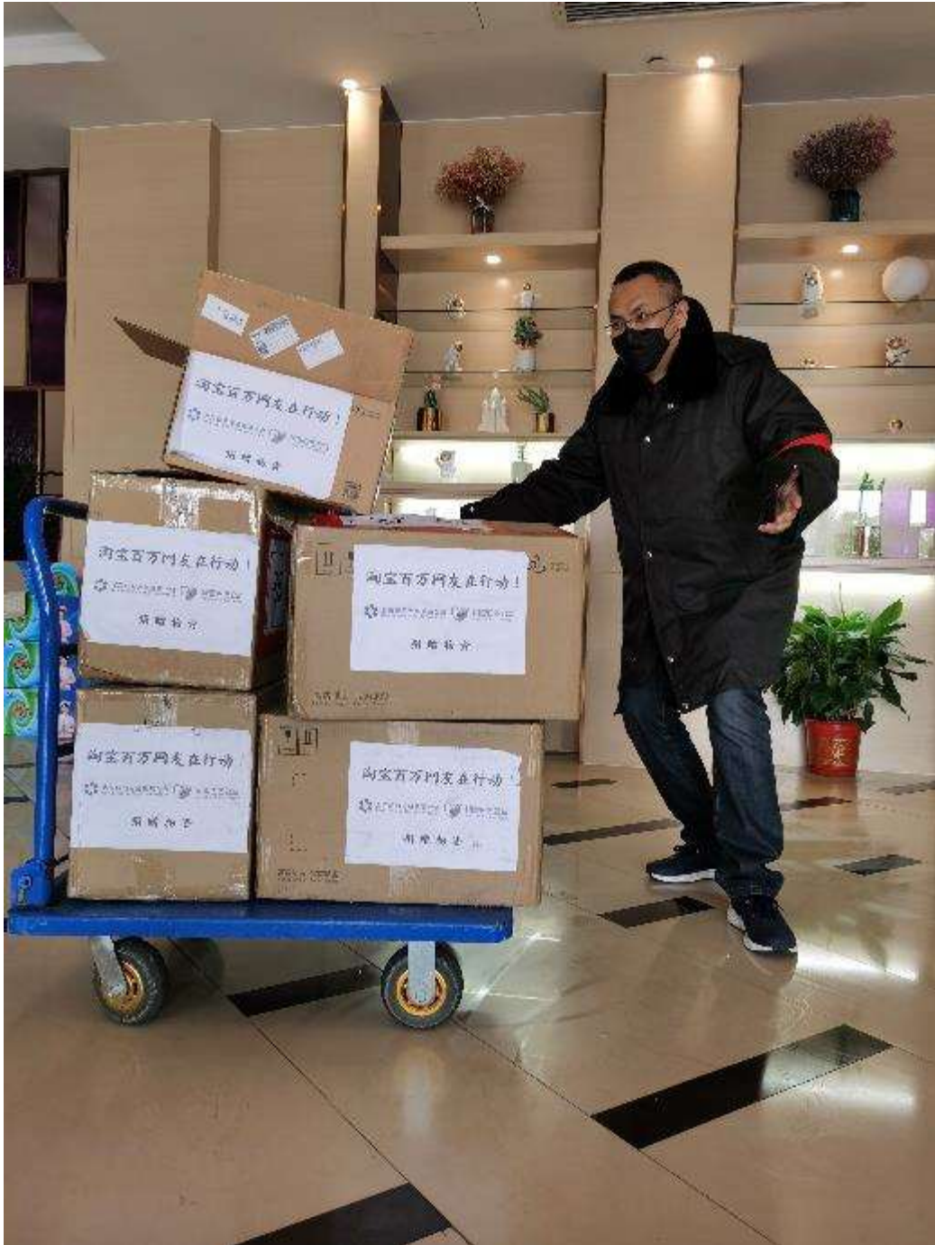
青海援助武汉医疗队队员收到高流量湿化氧疗仪之后开心得跳起了舞