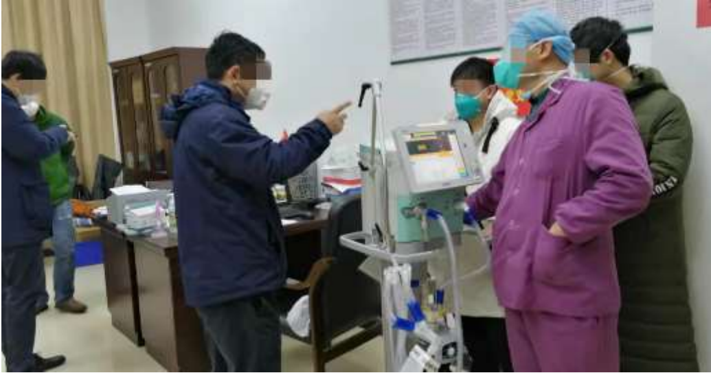
2月份，武汉市中医院汉阳院区正在使用我们捐赠的谊安呼吸机